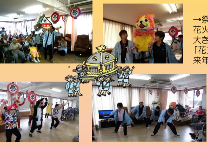
↑可愛い御神輿と迫力あるダンスに食い入るように見入っておられました。「御神輿が可愛くてよかったねえ。立派にできてたよ。」

ヨーヨー釣りに射的・綿あめ・かき氷…皆さん童心にかえってお祭りを満喫されました。 綿あめなんて何年振りだろう。美味しかったよ かき氷冷たくておいしいよ