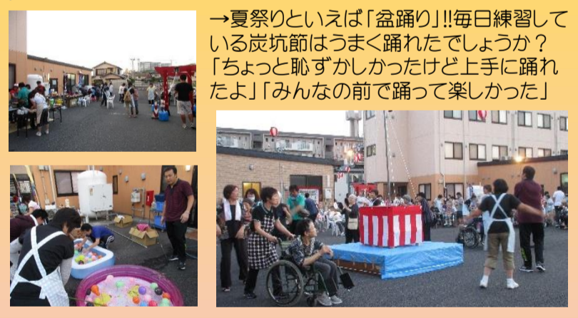
→夏祭りといえば「盆踊り」!!毎日練習している炭坑節はうまく踊れたでしょうか? 「ちょっと恥ずかしかったけど上手に踊れたよ」「みんなの前で踊って楽しかった」

職員からの施設長紹介 普段はしっかりしている職員や入居者様のことを大切に思っています。明るく優しいホーム長です。 また仕事以外の相談にも親身になって下さり、どりあえさく話してみたら「ん?」と「さく話してみたら「ん?」と「さく話してみたら「ん?」と」 時々、真剣な顔で天然発言で周りのみんなを笑わせた職員との冗談にも付き合っています。 職場を和ませてくださいます。仕込みの笑顔で入居者様だけなく職員共にも笑顔があり、施設内がとっても明るく楽しい職場になっています。